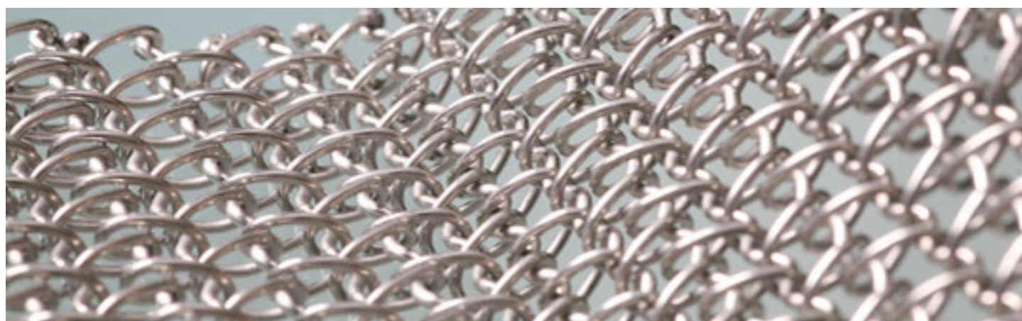
Frangisole AGPS Architecture Hohenbuhl - Zurigo